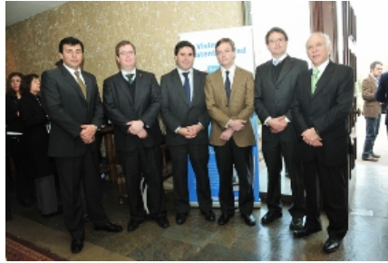
Jurídica de SIGA.

Importantes actores del sector público y privado intervinieron como expositores en el Seminario "Institucionalidad y Marco Jurídico Ambiental: El Nuevo Escenario para el Desarrollo de Proyectos Sustentables".